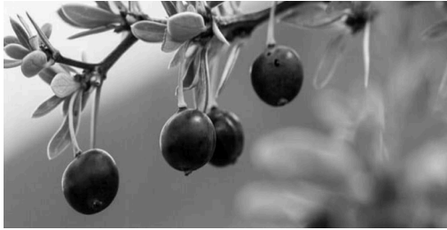
Imagen 2. Calafate ( Berberis microphylla )