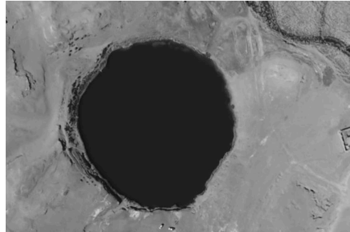
Imagen 1. Laguna Inca Coya.

El relato también menciona que en la laguna Inca Coya se sentían fuertes vientos, capaces de mover a una persona, lo que generaba temor y desconfianza entre los habitantes locales. Se creía que esos vientos eran la personificación del diablo, quien deseaba empujar y arrastrar a los curiosos. Según la leyenda, una vez que los atrapaba, los arrojaba a la laguna Ojo de Mar, donde los hundía en sus aguas. Los pobladores temían esta historia porque se decía que la laguna no tenía fondo, lo que significaba que, una vez alguien caía en ella, no había regreso. Para respaldar esta leyenda, en la región también se cuenta la trágica historia de Colque Coillur y Atahualpa, quienes supuestamente fueron víctimas de los misterios de la laguna Ojo de Mar.